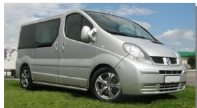
Excursions by Minibus

AUX CHAMPS SARL 法国欧赏有限公司 TEL: +33(0)6 70 90 17 43 www.auxchamps.cn